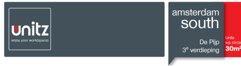
1 e Jan Steenstraat 84